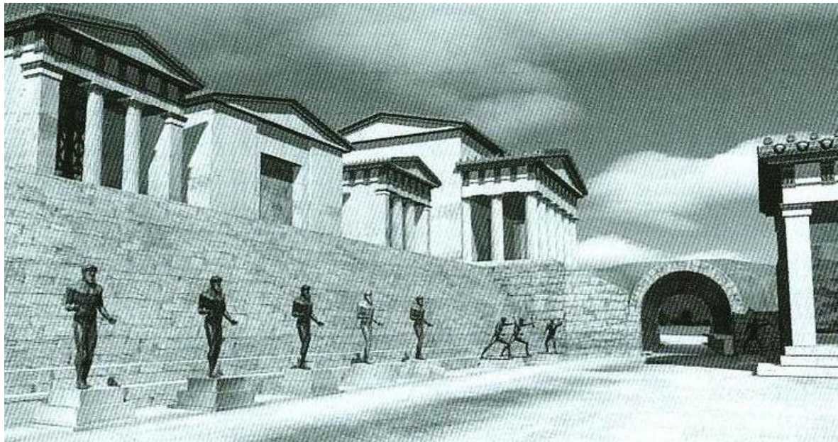
Fig. 3 De såkaldte Zanes for foden af skatkammerterrassen langs ruten ind til stadion, der skimtes bag den tøndehvælvede indgangstunnel i baggrunden. Virtuel rekonstruktion ved Powerhouse Museum, Sydney.

Elis' Hellanodikai kunne idømme atleter bøder, hvis de f.eks. brød reglerne eller forsøgte at bestikke deres modstandere, og de penge, der kom ind på denne måde, brugte Elis ved en række lejligheder til at lade fremstille og opstille bronzeskulpturer af Zeus, de såkaldte Zanes (eleisk dialekt for 'Zeus'er'). Disse Zanes stod ned for skatkammerterrassen langs den vej, der førte fra helligdommen ind på stadion. I det 4. årh. f. Kr. blev der opstillet tolv sådanne Zanes , som må have været iøjnefaldende monumenter over dommernes og Elis' magt i Olympia. For at ingen skulle misforstå budskabet, var skulpturernes baser udstyret med epigrammer; et af dem bekendtgjorde, at et orakel havde godkendt de bøder, der havde finansieret skulpturerne, mens et andet lovpriste eleierne for deres fromhed. 63