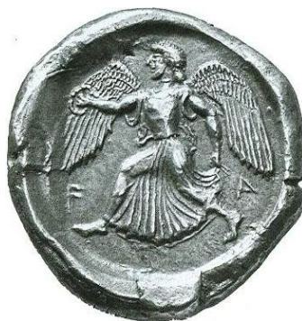
Fig. 4 I det sene 6. årh. f.Kr. begyndte Elis at slå mønter med typer af ypperligste kunstneriske kvalitet. Typerne refererer alle til helligdommen i Olympia og tjener således også til at understrege det tætte forhold mellem Olympia og Elis. Denne mønt, en sølv-stater fra ca. 460 f.Kr., viser gudinden Nike med den olympiske sejrskrans på vej for at bekranse en Olympionikes. Legenden FA er en forkortelse for FAΛEION, "eleiernes [mønt]". Om de eleiske mønters ikonografi, se Nielsen 2007, 43-5.

Det mest markante udtryk for Elis' kontrol over Olympia var dog to profane bygninger, bystaten lod opføre der, et prytaneion og et bouleuterion . Disse bygningstyper var helt almindelige rundt om i de græske byer og tjente den daglige administration af bystens anliggender: I bouleuterion holdt rådsforsamlingen sine møder, og prytaneion 64 var bystatens repræsentative bygning og symbolske centrum. Bygningerne lå derfor normalt i bystatens centrale bebyggelse. Særligt Olympias prytaneion , der blev opført i det 5. årh. f.Kr., er interessant i denne sammenhæng: Et prytaneion var som sagt en bystats symbolske centrum, og på bygningens arne brændte en flamme, der symboliserede selve bystatens liv. 65 Placeringen af Elis' prytaneion i Olympia var altså et arkitektonisk udtryk for, at Olympia var Elis' symbolske centrum. På Pausanias' tid afholdt Elis ved Legenes afslutning en reception for sejrherrene i prytaneion . Hvis denne reception eksisterede allerede i klassisk og hellenistisk tid, hvad der ikke er grund til at betvivle, vil dens placering i prytaneion have medvirket til at understrege over for sejrherrene, hvor uadskillelige størrelser Elis og Olympia var, samt at Elis var kilden til den enorme prestige, de fremover skulle nyde som Olympionikai , olympiske sejrherre. 66