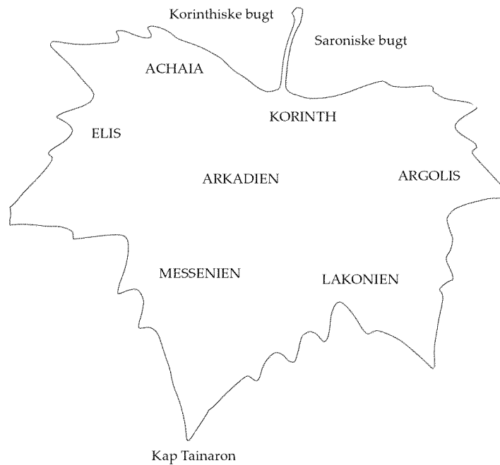
Fig. 2. Strabons Peloponnes har form som et platanblad.